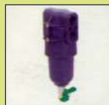
Filtro autopulente sulla mandata

I dati tecnici e i modelli riportati in questo catalogo si intendono non impegnativi. Ci riserviamo il diritto di modificarli senza obbligo