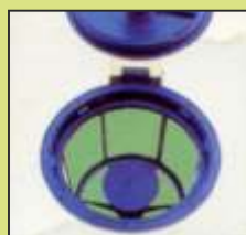
Premiscelatore per polveri