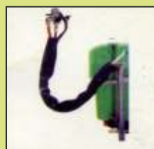
Comando a distanza sul trattore